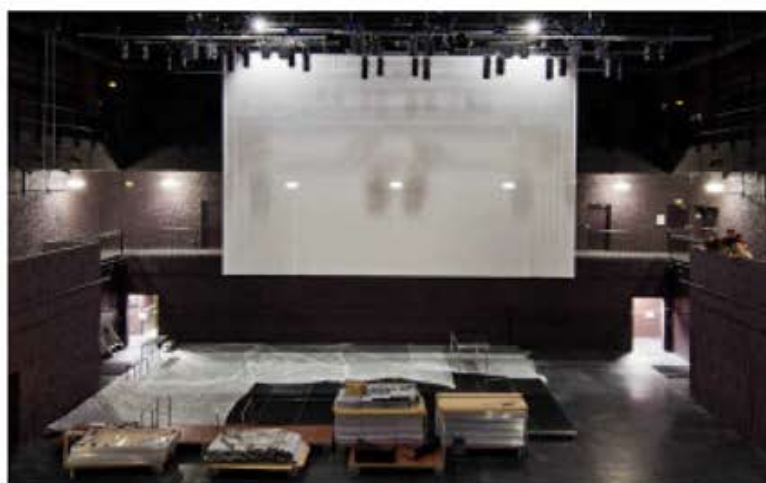
Théâtre 95 CERGY PONTOISE (95) Ecran de projection sur scène