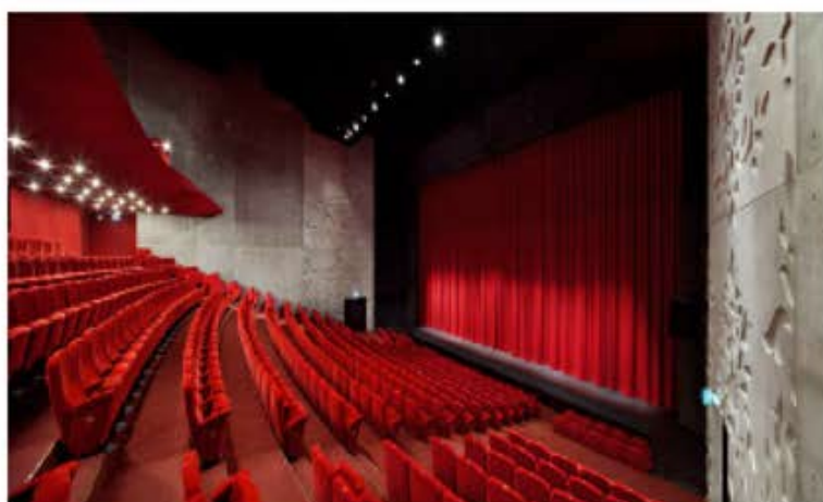
Théâtre SAINT NAZAIRE (44) Rideau de scène face salle