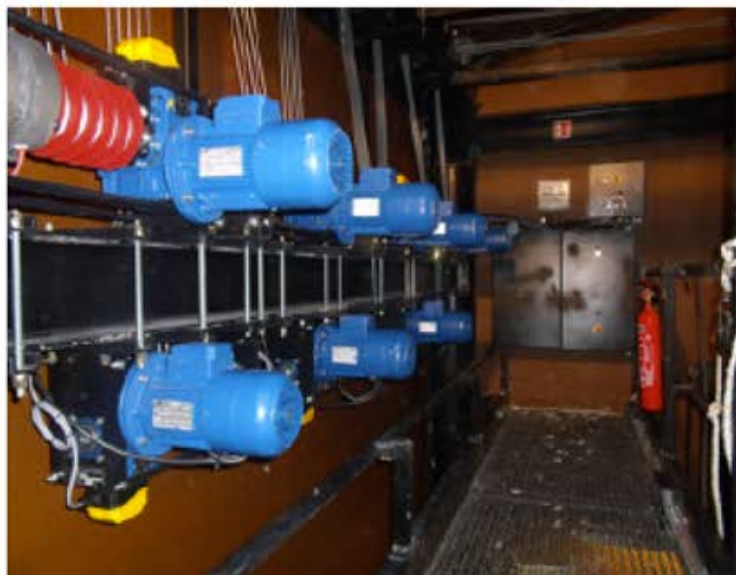
Salle Ernest Lambert CHATENOIS (88) Motorisation des équipes sur passerelle de scène