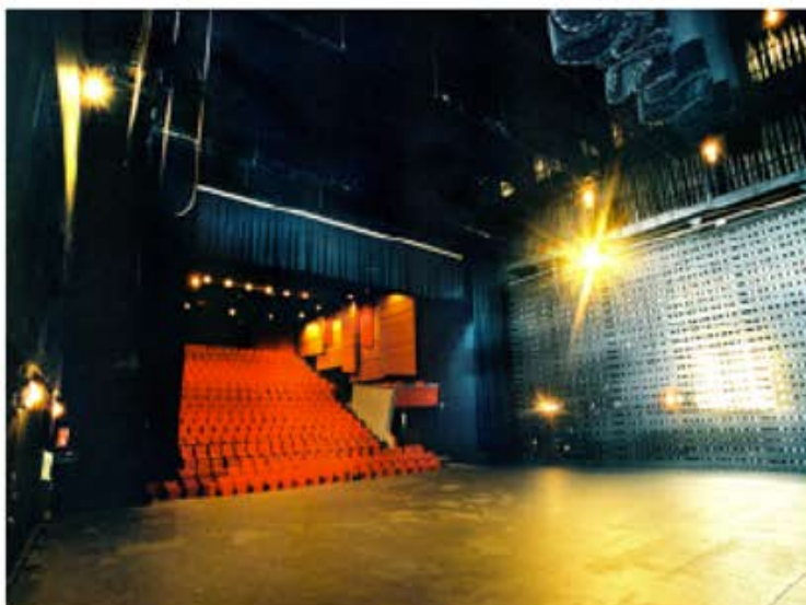
Théâtre BAR LE DUC (55) Cheminée de contrepoids sur scène